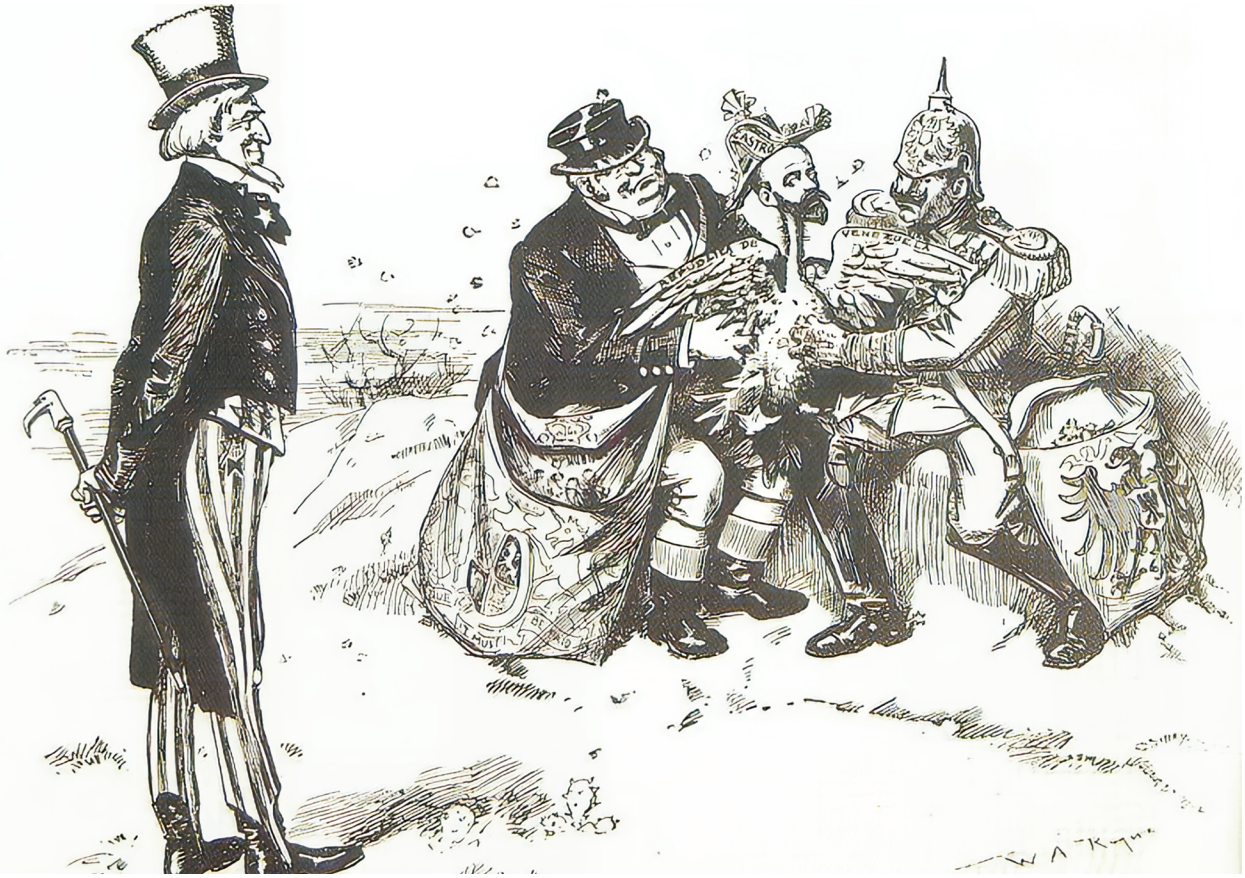
Figure 1. Caricature de Cipriano Castro, par W.A. Rogers, publiée dans The New York Herald , janvier 1903. (Domaine public)

Le 2 décembre 1902, Roosevelt prononce un nouveau discours devant le Congrès. Il se réjouit alors du déclin des guerres entre les puissances civilisées. Puis, il défend l'utilisation de la force par ces mêmes puissances civilisées pour discipliner les pays « délinquants » et assurer la paix mondiale 25 . Avec l'appui des États-Unis, les trois alliés européens ont donc les coudées franches pour attaquer le Venezuela.